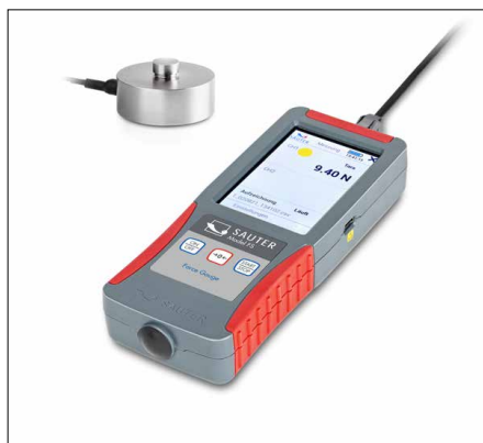
SAUTER FS RQ1

Juegos de dinamómetros SAUTER FS SP1 · FS RY1 · FS RQ1 · FS OY1 · FS OY2