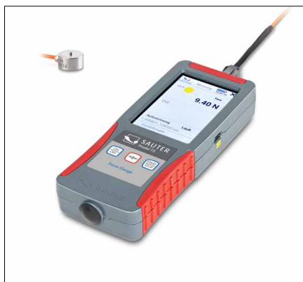
SAUTER FS OY1