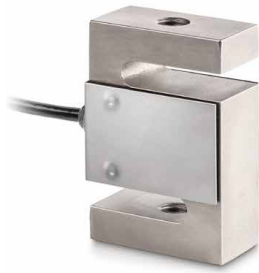
FS SP1 Para mediciones de fuerza en tracción y en compresión

Juegos de dinamómetros SAUTER FS SP1 · FS RY1 · FS RQ1 · FS OY1 · FS OY2