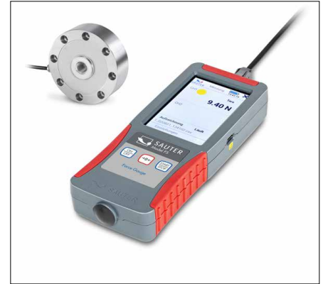
FS RY1 Para mediciones de fuerza en tracción y en compresión